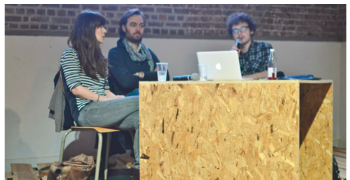
POPPOSITIONS 2013, Brass

In the past few decades, the art world has mainly been "blinded by economic fireworks", as Duchamp so aptly put it, dominated as it is by the neo-liberal mechanisms of the art market. And even in the current aftermath of the economic crisis, contemporary art is still doing relatively well as a product of financial investment. But does it hold true that the heydays of commercial grandeur are behind us, or, stronger even, that its speculative bubble is about to burst? And if we're really living through these "end times", what are the future perspectives in terms of collecting, both on a public and private level?