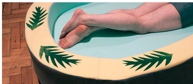
Erchen Chang, Millington Marriott, 2014

Un café mobile Broer Bretel , buffet végétarien d' El Turco , restaurant pop-up par Joris Vermeir , édition de Halo presse .