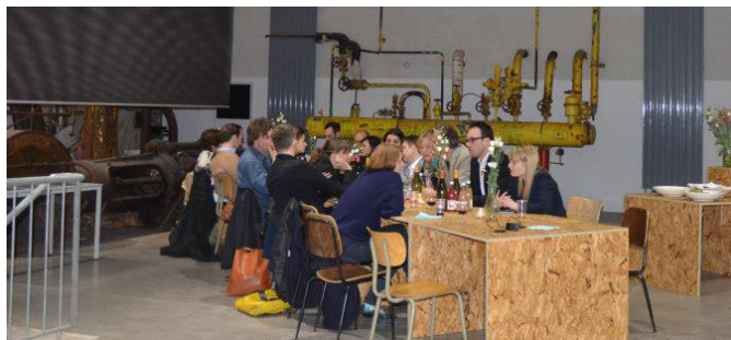
POPPOSITIONS Dinner 2013, Brass