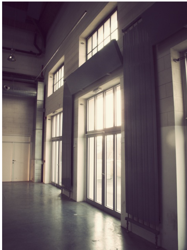
POPPOSITIONS 2013 Brass - Sarah Suco Torres

En investissant un bâtiment bruxellois historique différent chaque année, POPPOSITIONS permet aux habitants de re-découvrir un lieu qui leur est familier mis en